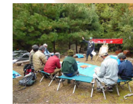
林業体験教室では、まず講義を聞いてから実習に取り組みます