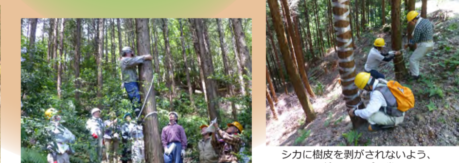
シカに樹皮を剥がされないよう、ヒノキの幹にテープを巻いています