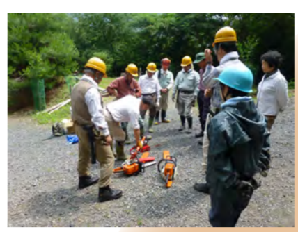
間伐作業の前にはチェーンソーの取扱い研修を...