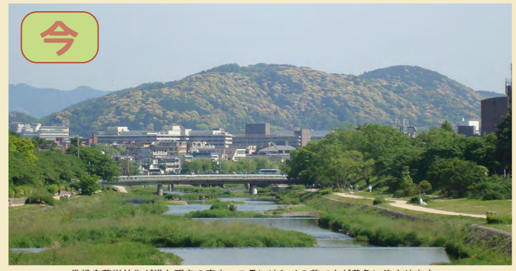
常緑広葉樹林化が進む現在の東山。5月にはシイの花で山が黄色に染まります。