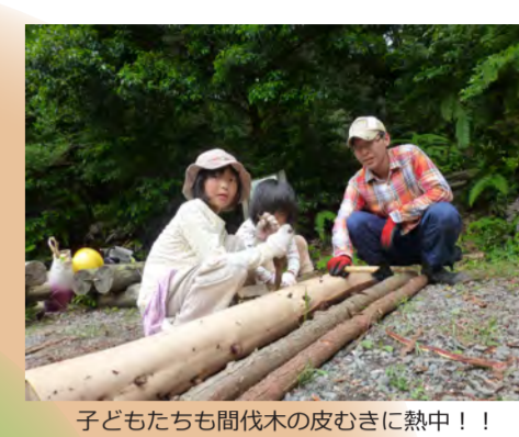
子どもたちも伐木の皮むきに熱中!!