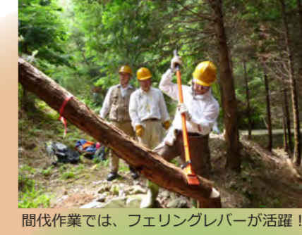
間伐作業では、フェリングレバーが活躍!