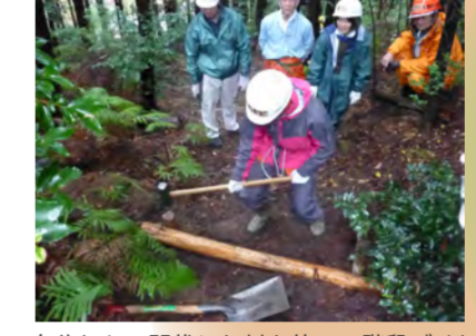
自分たちで間伐した材を使って階段づくり