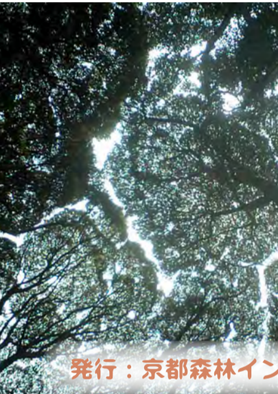
シイ林の樹冠 (Sugi forest canopy)