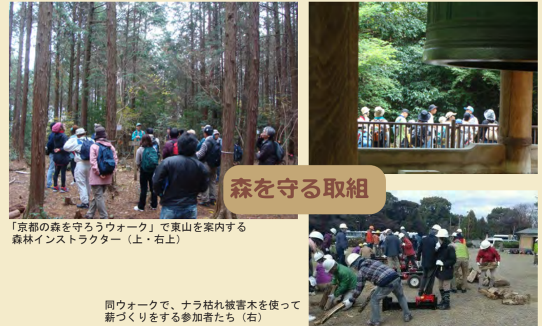
「京都の森を守ろうウォーク」で東山を案内する森林インストラクター(上・右上) 同ウォークで、ナラ枯れ被害木を使って薪づくりをする参加者たち(右)